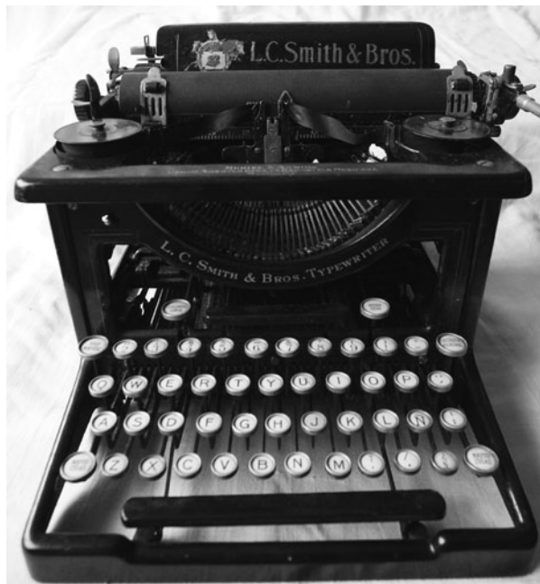
FIGURA 3. Máquina de escribir L. C. Smith & Bros., siglo XX, acervo del Museo de la Revolución en la Frontera, Ciudad Juárez, Chihuahua, INAH. En el caso de objetos de carácter “industrial”, o utilitario, la noción de antigüedad no es evidenciada por la alteración o cambio en los materiales constitutivos, sino mediante otras señales, en su caso, los elementos mecánicos como la tipografía, la técnica de manufactura y ensamblado de la máquina, sus elementos decorativos, entre otras.

tos), materiales constitutivos, técnica de manufactura, etc., como sucede con cierta frecuencia en el caso de los objetos “industriales”, cuyas alteraciones en sus materiales constitutivos, en condiciones propicias de almacenaje y manejo, se reducen considerablemente, pues su uso requería un mantenimiento continuo (Figura 3).