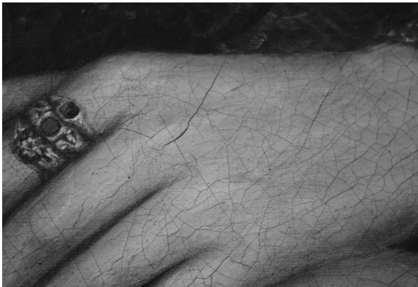
FIGURA 2. Retrato anónimo (detalle), exposición Genio y figura del siglo XIX , Morelia, Mich., INAH/Centro Cultural Clavijero. En esta imagen se advierten las transformaciones de la capa pictórica de un óleo sobre tela, las cuales ponen de manifiesto el envejecimiento de sus materiales constitutivos y que componen elementos de la pátina: patrón de craqueladura (Fotografía: Dora Méndez, 2010; cortesía: CNCPC-INAH).

damental, no es otra cosa que la identificación de la realidad formal de la obra: ésta, al tener su propia coherencia es, de hecho, el único criterio con el que se pueden medir las alteraciones, siempre que afecten a la forma. (Philippot 1969:2; cursivas de las autoras .)