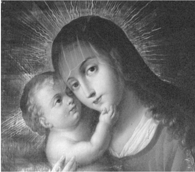
FIGURA 5. Virgen de Passaviense , Nicolás Rodríguez Juárez, siglo XVIII, acervo del Museo de Guadalupe, Zacatecas, INAH, México. En la imagen se observa el trabajo de veladuras en la pintura novohispana (Fotografía: Xochiquetzal Rodríguez, 2009; cortesía: CNCPC-INAH).

y la exudación del aglutinante hacia la superficie (Philippot 1969: 1). En otras palabras, se trata de cambios cuya naturaleza fisicoquímica los hacen irreversibles, lo que impide en definitiva una vuelta al original a través de un tratamiento de restauración: este proceso, en todo caso, no debería procurar restituir el estado “original” de la obra, pues las alteraciones ocurridas en el tiempo, como el amarillamiento y opacidad del barniz, tonos de azul que viran a un tono pardo, fisuras, pérdida de profundidad en los tonos, etc., visibles en la Figura 6, ponen de manifiesto otros valores intrínsecos, como su autenticidad. (Philippot 1969:1).