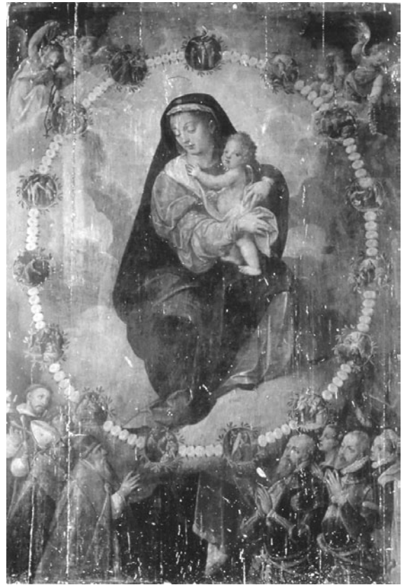
FIGURA 6. Virgen del Rosario , Andrés de Concha, siglo XVI, Templo del ex convento de Santo Domingo Yanhuitlán, Oaxaca. Ilustración sobre las alteraciones visibles en los materiales constitutivos de una pintura ocurridas por envejecimiento: amarillamiento y opacidad del barniz, tonos de azul que viran a un tono pardo, fisuras, pérdida de profundidad en los tonos, etc. (Fotografía: Ricardo Castro, 2000; cortesía: CNCPC- INAH).

Ciertamente, hoy en día los criterios de intervención y los factores que han de considerarse para determinar los límites de un proceso de restauración son algo distintos de aquellos que predominaban cuando surgieron la teoría “tradicional” de la restauración y los escritos de los estudiosos de los años sesenta del siglo pasado —de ahí que algunas de sus afirmaciones parezcan “desfasadas” o fuera de contexto—. Actualmente, el campo de interés de la teoría ha cambiado en cuanto a que las obras de arte, por su importancia, se han equiparado a otros tipos de bienes; esto es, han cobrado mayor interés los aspectos sociológicos y antropológicos, que en conjunto han modificado la forma de ver el arte y la cultura. Desde 1972 la UNESCO planteó la necesidad de “ampliar” el concepto de patrimonio cultural , para incluir en la categoría de bienes culturales los objetos de carácter etnográfico, bibliográfico, científico, etc., iniciativa que no se consolidó sino hasta la siguiente década, cuando, entre otros