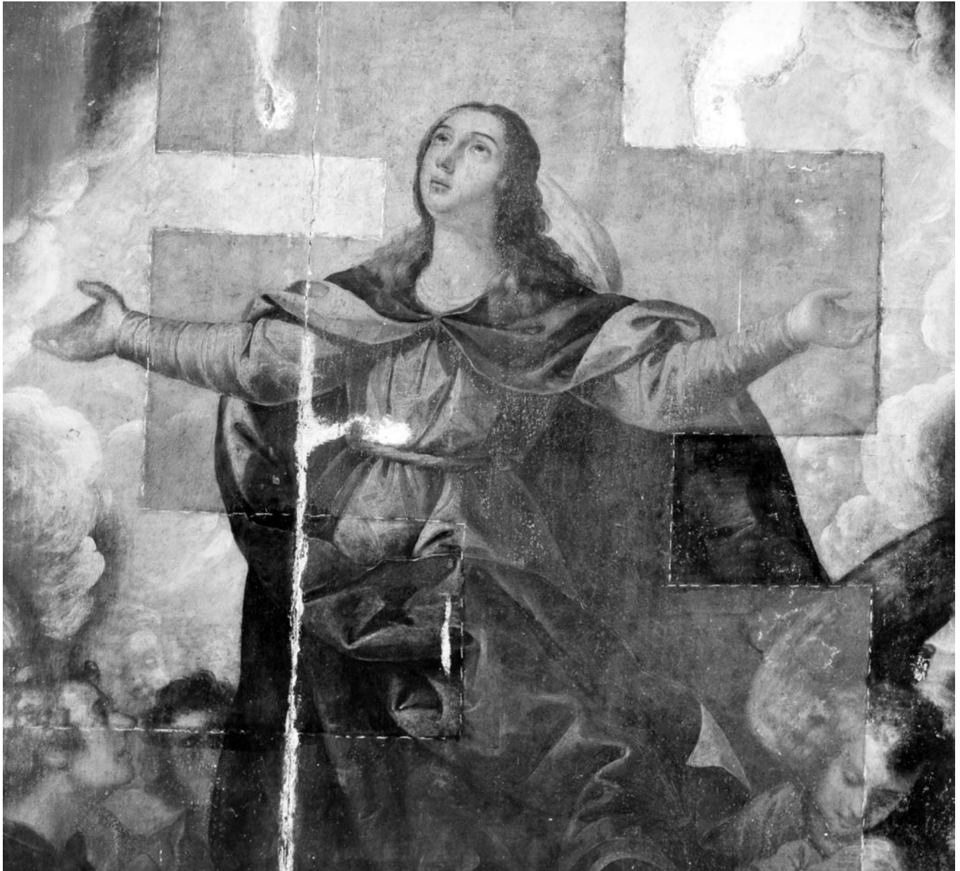
FIGURA 4. La Asunción de la Virgen , Anónimo, siglo XVIII, acervo del Museo Nacional de las Intervenciones, INAH. En la imagen se observa el proceso de limpieza selectiva, realizada por cuadrantes.

afirma que si en la pintura se elimina la capa (que pudiera ser casi imperceptible) impuesta por el tiempo y la enmascara, no se devuelve a ésta —ya transformada irremediabilmente— a su estado original, sino que en apariencia adquiere una limpidez y una agresividad que contradicen su edad. Además, Philippot (1969:1) asevera que el proceso no podrá restablecer nunca el estado original de una pintura, en virtud de que sus materiales han sufrido una modificación en su naturaleza constitutiva. Considera, asimismo, que las limpiezas radicales ponen en peligro las veladuras —técnica utilizada en pintura al óleo a partir del siglo XV y que puede apreciarse en numerosas obras novohispanas (Figura 5)—, que son las ca-