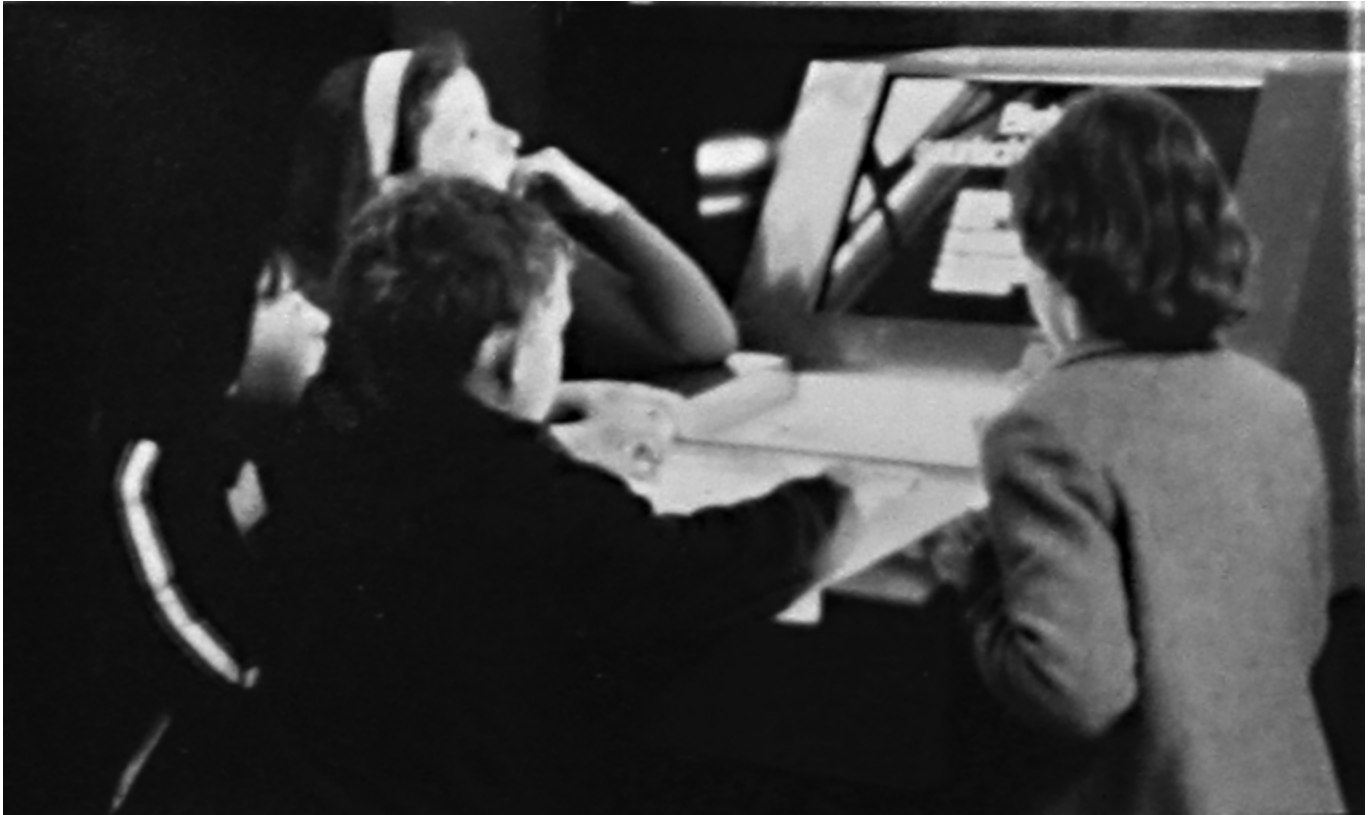
FIGURA 1. Uno de los módulos interactivos instalados en la exposición Human Biology inaugurada en mayo de 1977 en el Natural History Museum (NHM) de Londres. Se trata de la primera exposición del nuevo programa de exposiciones (NPE). Estas exposiciones ya no se basaban sólo en la reunión de colecciones, sino que hacían explícito el mensaje mediante nuevas estrategias comunicativas.

el enfoque propuesto por Miles como propagandístico, coercitivo y con un propósito limitado de antemano. En su opinión, una exposición regida por un guion y estructurada a tal extremo “restringía la libertad del visitante para explorar y descubrir” los elementos que decidiera y como lo decidiera (Seddon 1979).