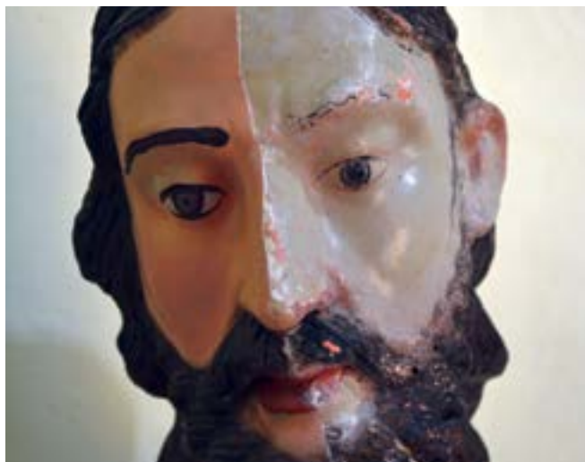
FIGURA 9. Eliminación de los repintes de las carnaciones en el que se dejan ver parte de la policromía original y elementos característicos en las formas del Taller de Cortés.

Atender las múltiples posibilidades que ofrecen las intervenciones de nuestro patrimonio, y generar su