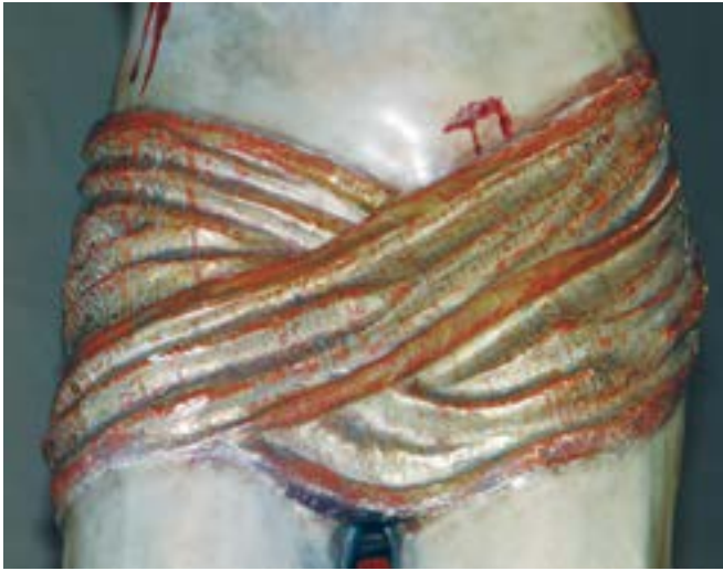
FIGURA 4. Paño de pureza del Señor de las Misericordias, Catedral de Tlalnepantla. Escultura ligera con caña de maíz, Taller de Cortés, finales del siglo XVI.

sencillo consiste en comprobar cómo no está tan alejado formalmente de obras como el famoso Cristo Resucitado de la iglesia sevillana de la Magdalena, entre cuyas corporaciones penitenciales, la de la Quinta Angustia, venera el famoso simulacro realizado por el célebre escultor Jerónimo Hernández, con quien contrataron la pieza en mayo de 1582. 5 En efecto, ambas efigies, indistintamente de un hipotético vínculo más próximo del que planteo, son resultado de un similar panorama devocional y obedecen a los postulados estéticos vigentes, acordes con un momento en el que se potencia la representación escultórica de esta iconografía; argumento que necesariamente ha de tenerse en cuenta para comprender el particular encargo de la pieza mexicana y lo señalado de su uso en la Pascua de Resurrección.