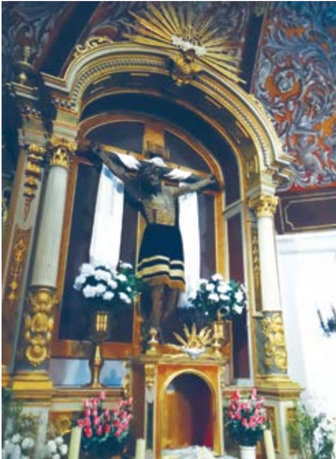
FIGURA 6. Señor de la Salud, Ermita de San Lázaro, Trujillo, España. Escultura ligera con caña de maíz, Taller de Cortés, finales del siglo XVI.

Respecto de los brazos, se ha dicho, retomando la descripción histórica, que “también están huecos, mas no se distingue en ellos la clase de horma sobre que está formado el cuerpo, sino unos simples rollos cilíndricos de capas de la materia que se describirá...” (Velasco 1858: 153), lo que se cumple, asimismo, en otros crucificados que he estudiado. Ahora bien, en la efigie de Tlalnepantla éstos varían sustancialmente, ya que están contruidos mayormente con madera ligera de colorín, 8 tal y como se refleja en la tomografía. El cambio tendría explicación en su adaptación iconográfica, pero también indicaría aquella llamada de atención que señalaba cuando lo estudié formalmente respecto de cierta dificultad en su trazado.