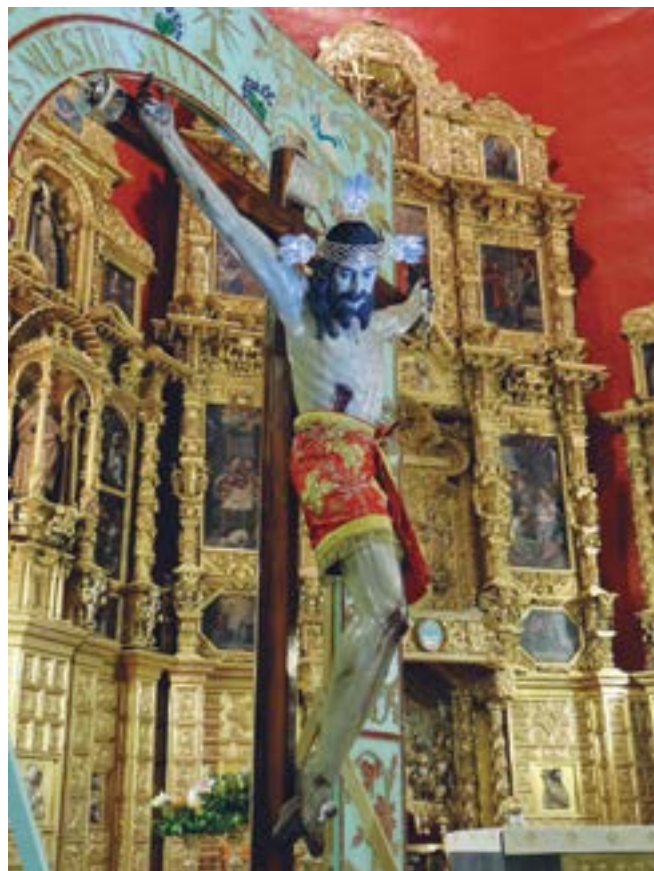
FIGURA 3. Señor de la Misericordias, Catedral de Tlalnepantla. Escultura ligera con caña de maíz, Taller de Cortés, finales del siglo XVI (Fotografía: Pablo F. Amador Marrero, 2015).

y también de su diseño. Éste es, como luego se recuperó, un sencillo esgrafiado sobre temple blanco a base de franjas (Figura 4).