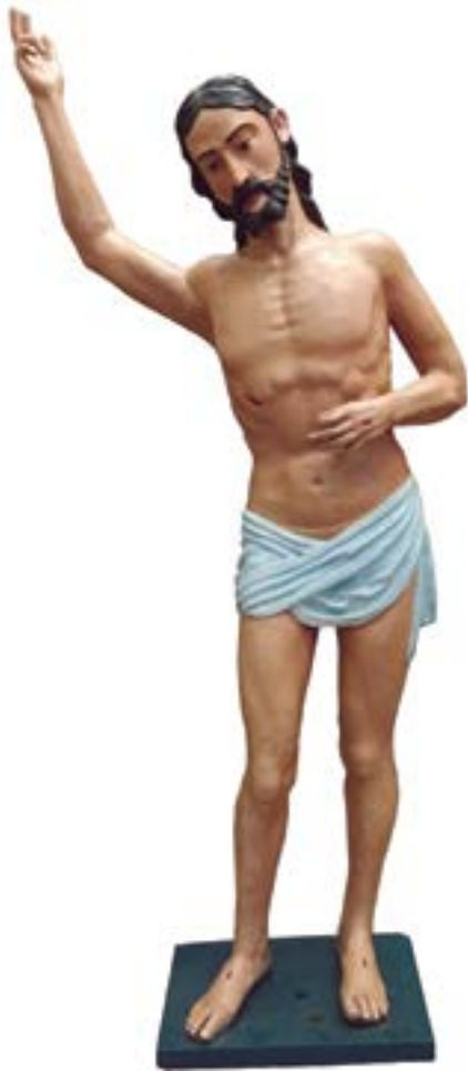
FIGURA 1. Señor de la Ascensión (Cristo Resucitado) antes de la restauración, Catedral de Tlalnepantla. Escultura ligera con caña de maíz, Taller de Cortés, finales del siglo XVI (Fotografía: Claudia Alejandra Garza Villegas, 2016).

Posteriormente, con motivo de la exposición Al canto de las quimeras. Luis Lagarto y la fábrica de la cantoría de la Catedral de Puebla, 1600-1611 , la imagen fue solicitada para incluirla en la sección “Luis Lagarto en el arte de su tiempo”, en la que hacía un elocuente pendant con una de las miniaturas del citado iluminador que comparten similar tema y postura, acorde con los postulados iconográficos vigentes en las décadas de transición entre los siglos XVI y XVII 2 (Figura 2).