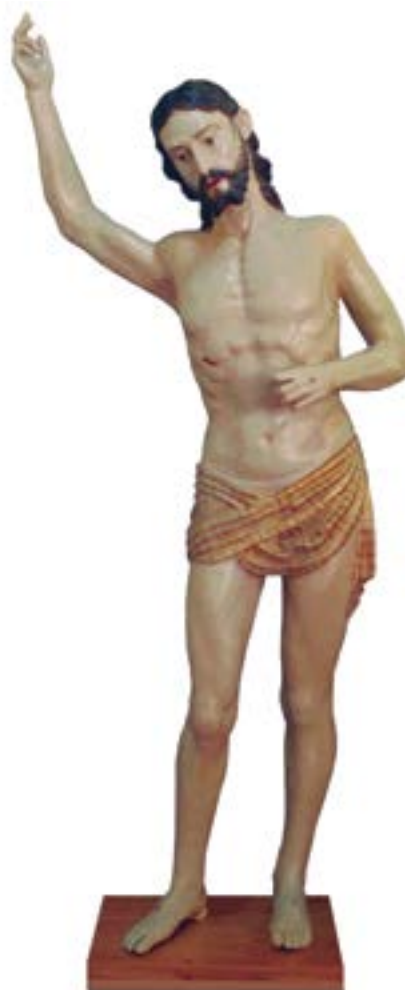
FIGURA 10. Señor de la Ascensión (Cristo Resucitado) después de la restauración, Catedral de Tlalnepantla. Escultura ligera con caña de maíz, Taller de Cortés, finales del siglo XVI.