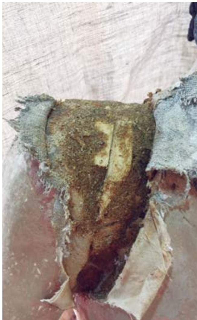
FIGURA 7. Identificación de entelados sobre el soporte en el Señor de la Ascensión visibles gracias al proceso de restauración.

Llegado a este punto, transcurrido el tiempo necesario para el fraguado de los adhesivos y, con ello, la evaporación de la mayor parte de la notable cantidad de humedad derivada del sistema constructivo, se dio paso a las fases ocultas del proceso policromo. Siguiendo la tradición española, esa parte del trabajo se inició con la aplicación de los aparejos que, según la zona, varían su grosor notablemente, lo que indica que también se usaron para ajustar el acabado anatómico. Ese estrato se compone de dos capas, ambas aglutinadas en cola; la primera llega hasta 450 µm y está constituida por sulfato de calcio, yeso (CaSO 4 ), en el que se detecta la presencia de aluminosilicatos. De color blanco amarillento, por la dispar molinada de la carga y el grosor de muchas de sus partículas, esa