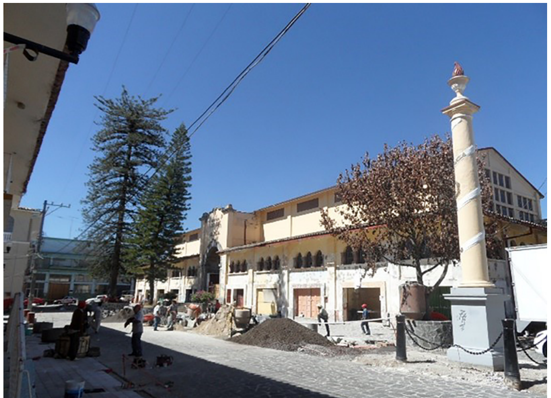
FIGURA 3. Proceso de las obras de recuperación de la plaza Alcalde y García, 2000, en el barrio de San José.

En los últimos 20 años los gobiernos estatal y municipal han realizado diversas intervenciones en el espacio público. Entre las más importantes se cuentan la recuperación de la plaza Alcalde y García (2000) y de la plazuela del Carbón (2012); la creación del corredor Carlos Fuentes (2013), espacio ganado a la calle Miguel Palacios, en el centro de la ciudad; la rehabilitación de la plaza del barrio de Xallitic (2013); la remodelación del parque 5 de Febrero, y la recuperación de la plazuela Manuel Maples Arce (2016-2017) (Figuras 3, 4 y 5).