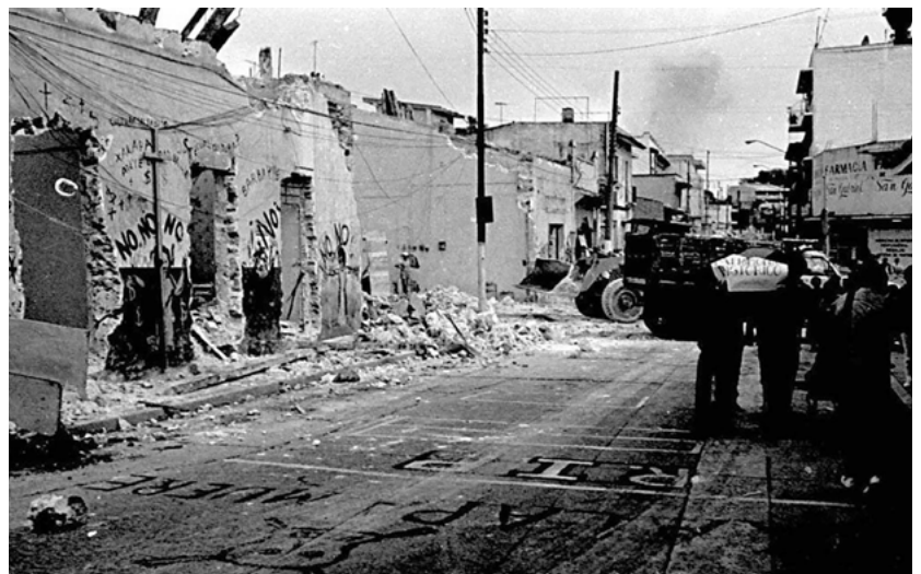
FIGURA 2. Protestas ciudadanas ante la demolición de casas antiguas por la ampliación del acotamiento de la calle Xalapeños Ilustres (Fuente: Xalapa en la historia, 2017).

Entre los logros de esos colectivos cabe destacar: la suspensión de las demoliciones del antiguo Cementerio Xalapeño, y la obtención de su declaratoria federal, así como del conjunto arquitectónico Salvador Díaz Mirón, frente al parque de Los Berros; el cese a las alteraciones parciales al parque Juárez, y la modificación del proyecto que alteraba el lenguaje original del inmueble que hoy ocupa la Biblioteca Carlos Fuentes. Se organizó, asimismo, un buen número de actividades académicas en pro de la valoración, difusión, conservación y restauración respetuosa del patrimonio. En el ámbito municipal se creó la Comisión de Conservación y Control del Centro Histórico (1989) y, más adelante, tanto la Oficina del Centro Histórico (1998) como la Unidad del Centro Histórico e Imagen Urbana (2010), aunque esta última, desafortunadamente, dejó de existir en 2018.