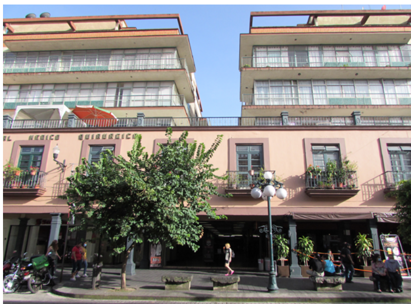
FIGURA 6. Antigua Calle Real, hoy Enríquez. En primer plano, las intervenciones de 2017: ampliación de banquetas, colocación de bancas de piedra extraída de la calzada virreinal durante las excavaciones de repavimentación; al fondo, intervención en la imagen urbana (1986-1989), con modificación de la fachada del edificio funcionalista conocido como “Enríquez”.

las acciones consistieron en reutilizarlas con nuevos cambios de uso, en su mayoría, culturales o educativos.