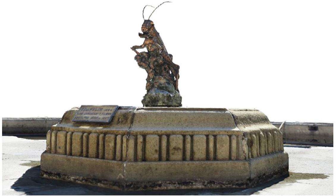
FIGURA 5. Fuente del Chapulín , Alcázar del MNH. Modelo tridimensional elaborado por fotogrametría digital (Levantamiento y elaboración de modelo: Emanuel Herrera Dávila, 16 de enero de 2023; cortesía: Museo Nacional de Historia, CNMH).