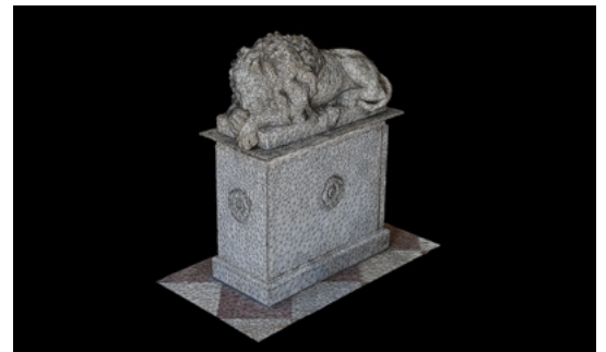
FIGURA 7. Imagen de la malla con textura en la Escalinata de los Leones , Alcázar del MNH. Modelo tridimensional elaborado por fotogrametría digital (Levantamiento y elaboración de modelo: María Sánchez Vega, 16 de enero de 2023; cortesía: Museo Nacional de Historia, CNMH).