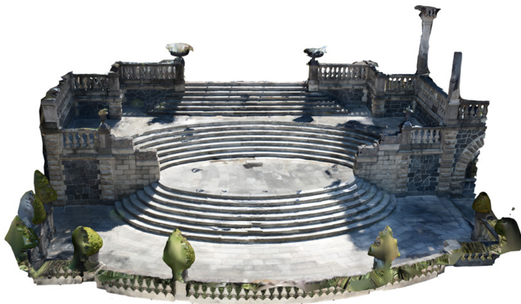
FIGURA 4. Escalinata del Jardín de las Pérgolas , MNH. Modelo tridimensional elaborado por fotogrametría digital (Levantamiento y elaboración del modelo: Áyax Horacio Segura Galván, 14 de enero de 2023; cortesía: Museo Nacional de Historia, CNMH).