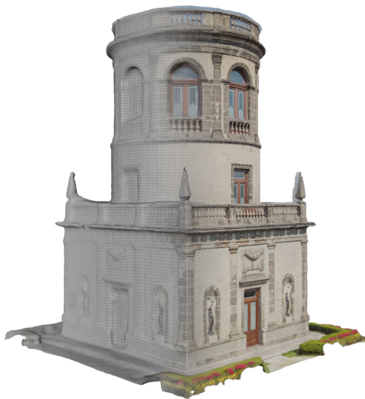
FIGURA 3. Caballero Alto, MNH. Modelo tridimensional elaborado por fotogrametría digital (Levantamiento y elaboración de modelo: Marisela González Quiroz, 12 de enero de 2023; cortesía: Museo Nacional de Historia, CNMH).