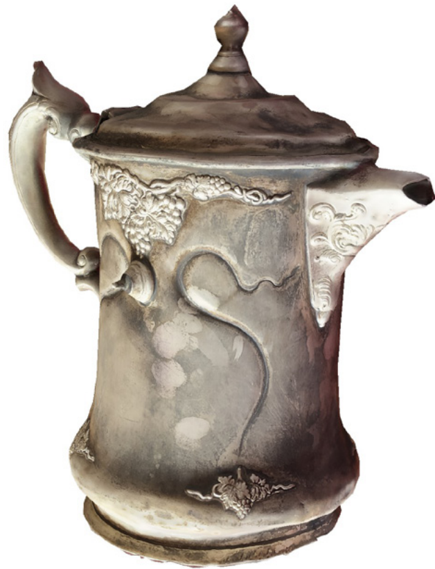
FIGURA 8. Jarra de samovar del MNH. Modelo tridimensional elaborado por fotogrametría digital (Levantamiento y elaboración de modelo: Ángel Mora Flores, 17 de enero de 2023; cortesía: Museo Nacional de Historia, CNMH).

También se practicaron ejercicios de unión de modelos tridimensionales de espacios interiores con exteriores, para contar con un inmueble o sitio levantados en su totalidad, y levantamientos digitales con aplicaciones o Apps diseñadas para sistema operativo ios en el celular, sólo para explorar el sensor LiDAR en los dispositivos de Iphone PRO. Además, se hizo una práctica para exportar la nube de puntos de Agisoft Metashape 2.0 a AutoCAD utilizando Autodesk ReCap como programa intermediario entre los dos anteriores para realizar el dibujo de planos.