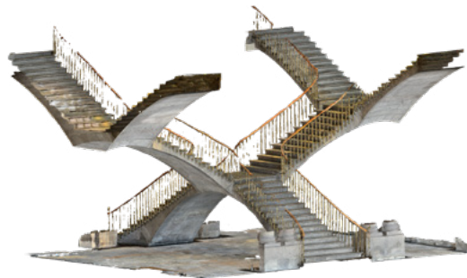
FIGURA 6. Escalera, del MNH. Modelo tridimensional elaborado por fotogrametría digital (Levantamiento y elaboración de modelo: Fabián Bernal Orozco Barrera, 16 de enero de 2023; cortesía: Museo Nacional de Historia, CNMH).