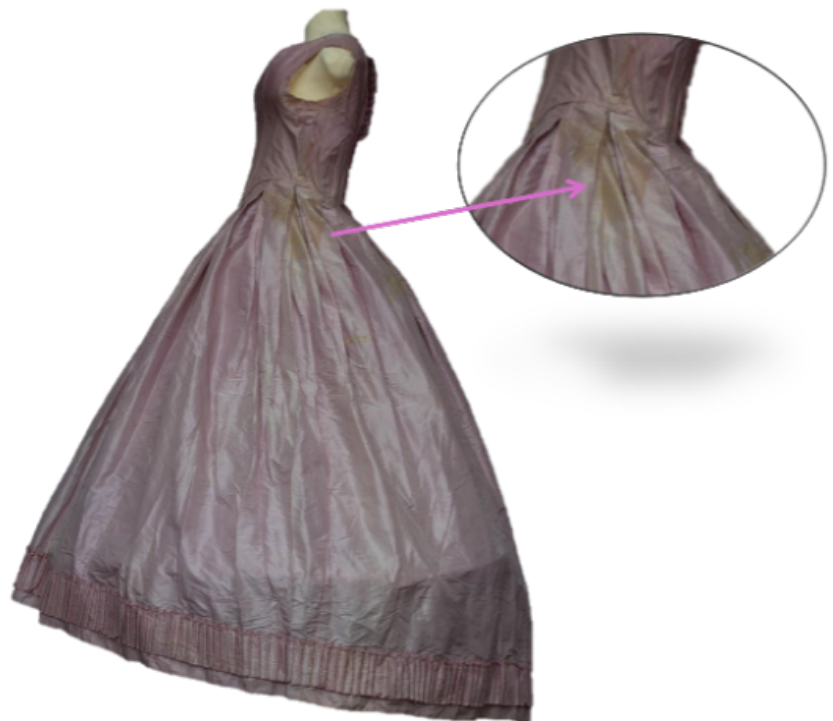
FIGURA 3. Fotografía de la mancha de vino en la parte izquierda superior del vestido.