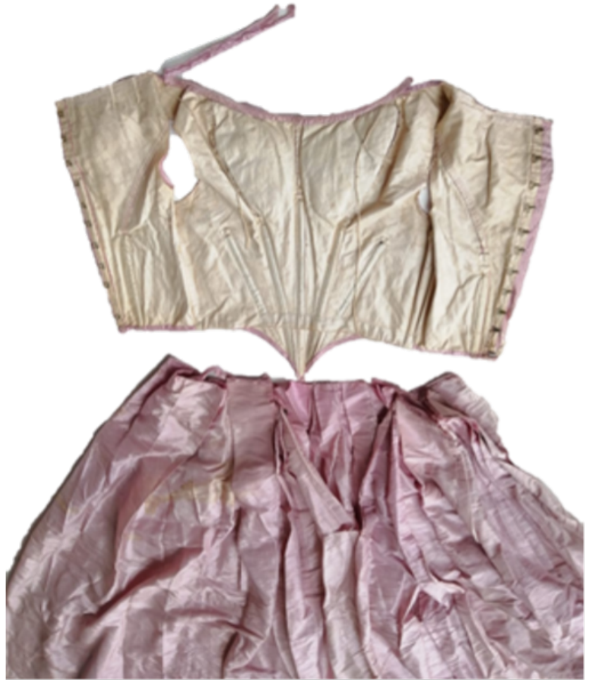
FIGURA 7. Separación de jubón y falda (Fotografía: Dante Chávez, 2022; cortesía: Seminario-Taller de Restauración de Textiles-ENCRYM).

Colaborar con el MNH en la toma de decisiones para la intervención de este vestido fue necesario y aditivo; dejó clara la relevancia de involucrar a las diversas áreas especializadas en esta propuesta y evidenció que la restauración se hace en conjunto con los sectores e instituciones participantes, en este caso, la Escuela Nacional de Conservación, Restauración y Museografía (ENCRYM) y el Museo Nacional de Historia “Castillo de Chapultepec” (MNH). Tal como se observa en el diagrama (Figura 8), la integración de esfuerzos es parte de nuestro quehacer como restauradores profesionales, por lo que nuestra responsabilidad como especialistas no termina en el momento en que una pieza deja el taller, sino que es parte de nuestro quehacer profesional facilitar la difusión del conocimiento adquirido a todos cuantos custodian, investigan y disfrutan de las piezas. La visión desde la restauración aporta las observaciones directas del objeto, su relación e interacción tanto material como de significados socioculturales, por lo que constituyen información valiosa de una fuente primaria, lo que permite aportar conocimien-