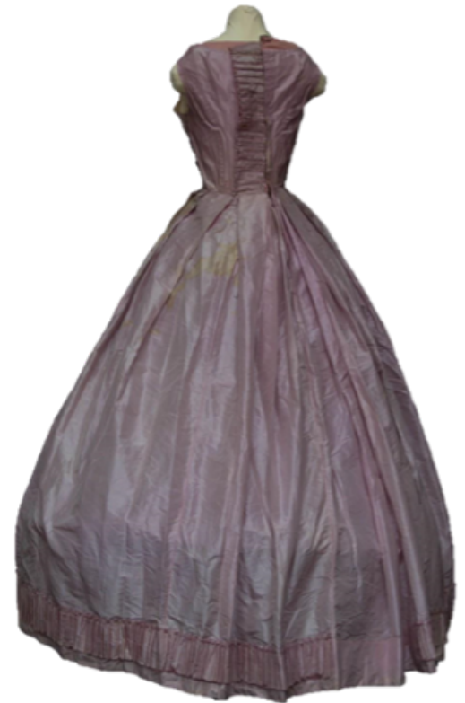
FIGURA 6. Vestido de la emperatriz Carlota. Vista posterior antes de la intervención (Fotografía: Gerardo Hellion, 2022; cortesía: Seminario-Taller de Restauración de Textiles-ENCRYM).