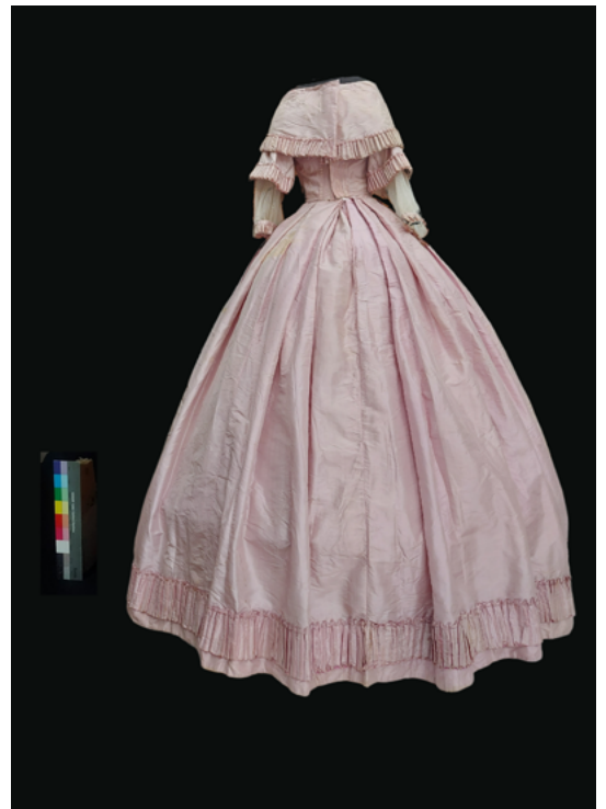
FIGURA 12. Fotografía de final de proceso. Vista posterior del vestido (Fotografía: Gerardo Hellion, 2022; cortesía: Seminario-Taller de Restauración de Textiles-ENCRyM).