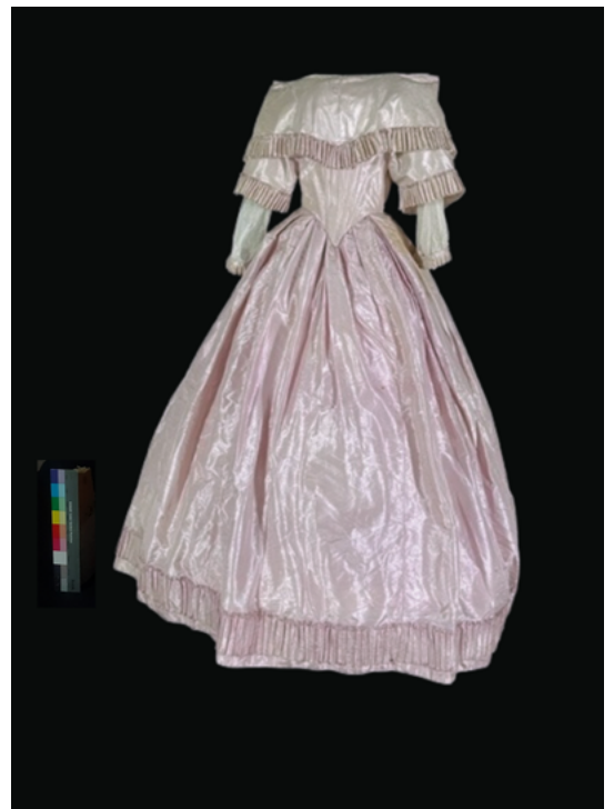
FIGURA 11. Fotografía de final de proceso. Vista frontal del vestido (Fotografía: Gerardo Hellion, 2022; cortesía: Seminario-Taller de Restauración de Textiles-ENCRyM).