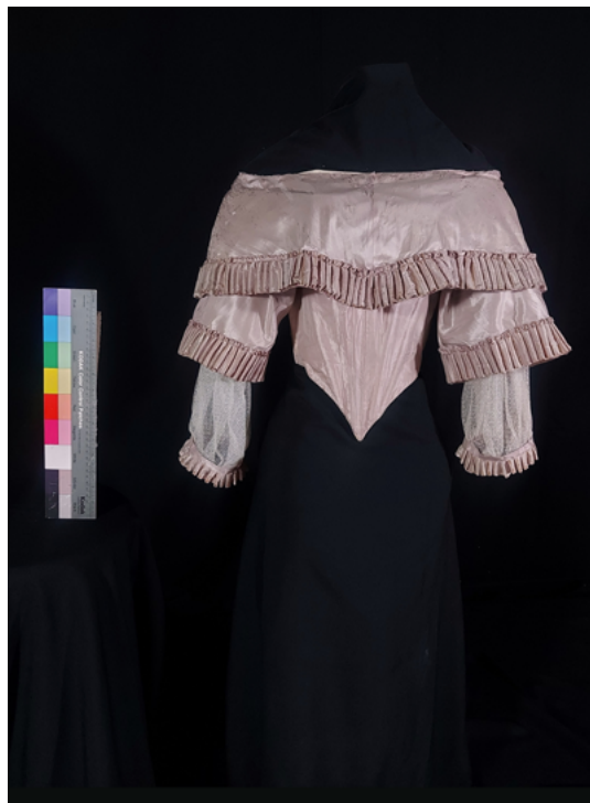
FIGURA 10. Fotografía de final de proceso del jubón.