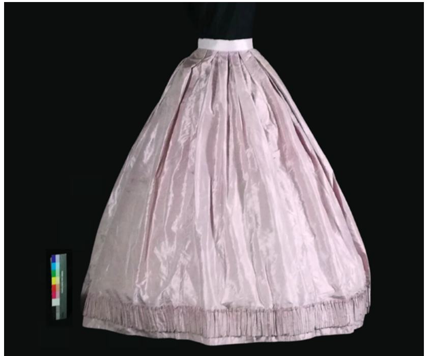
FIGURA 9. Fotografía de final de proceso de la falda.

El resultado final de esta travesía queda ante los ojos de quienes nos leen (Figuras 9, 10, 11 y 12) y de quienes, esperamos, puedan disfrutar tanto como nosotras de esta pieza única que nos desveló partes de su trayecto por la historia de nuestro México.