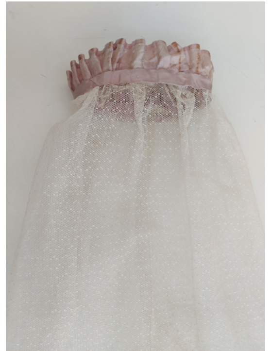
FIGURA 2. Fotografía del encaje de algodón de las mangas.

Como ya se mencionó, era importante el origen de la manufactura, como lo fue la red de apoyo profesional para aproximarnos a su estudio. En ese sentido, Elizabeth Schaeffer, conservadora del Metropolitan Museum of Art (MET, Nueva York), nos compartió su apreciación, y, con base en su experiencia, indicó que el estilo pertenece a 1860, periodo en el que Carlota aún vivía en Europa. La manufactura, pues, coincide con la tendencia europea de la época, en que las redes de comercio textil fueron determinantes para la obtención de la tafeta de seda y el encaje de bolillo (Ocampo, 1990).