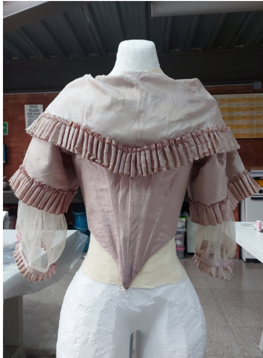
FIGURA 1. Jubón del vestido.