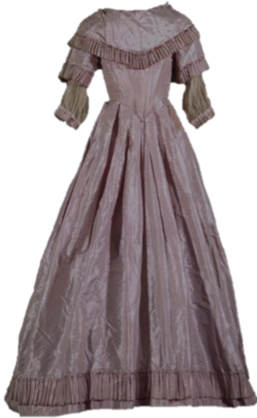
FIGURA 5. Vestido de la emperatriz Carlota. Vista frontal previa a la intervención (Fotografía: Gerardo Hellion, 2022; cortesía: Seminario-Taller de Restauración de Textiles-ENCRYM).

cánicas que continuaran debilitando ambos elementos y, aunado a ello, colocar la escarola de la espalda en su sitio inicial: el ruedo de la falda, para, finalmente, retirar los añadidos de algodón teñidos de color rosa que modificaron las medidas totales y generaron estiramientos y roturas en la tafeta de seda (Figuras 5, 6 y 7).