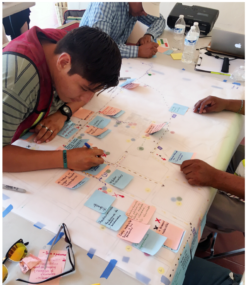
FIGURA 1. Elaboración de mapas participativos durante el taller.